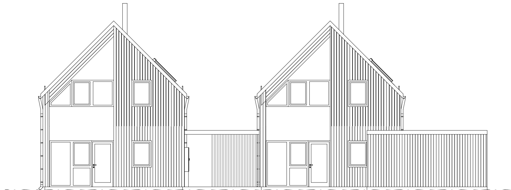
Fasade mot vest