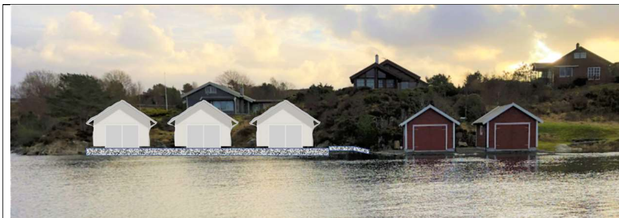
Skisse over naustene sett forfra