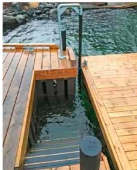
Tilkomst til flytebrygge er planlagt med innfelt trapp

Foto av samme bryggeløsning som det her blir søkt om.