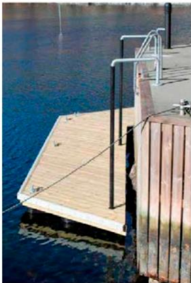
Spesialtilpasset vinke/brygge på glidestang

Adkomst til flytebrygge er planlagt med innfelt trapp i eksisterende brygge.