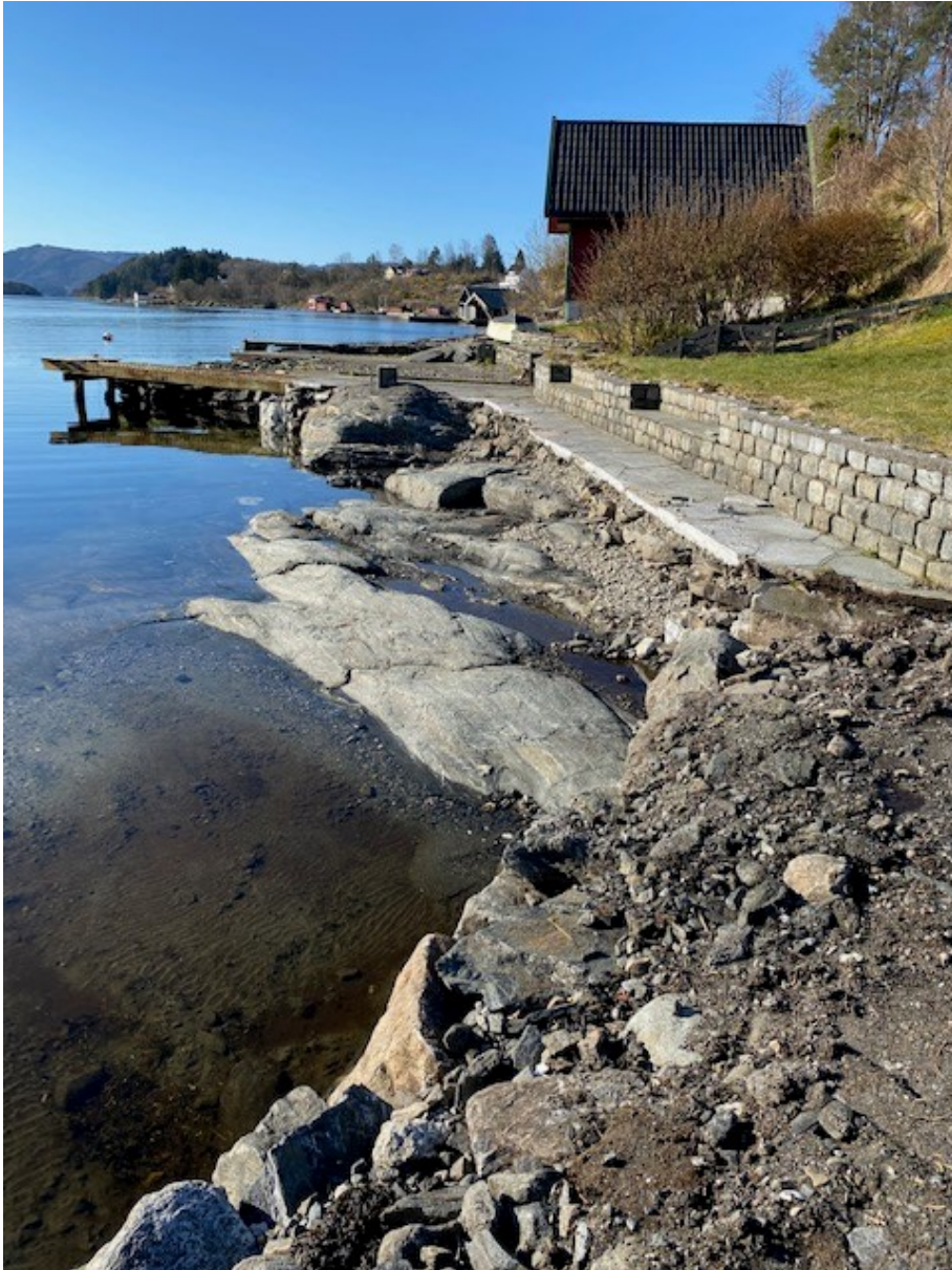
Gbnr 212/45 – 2020