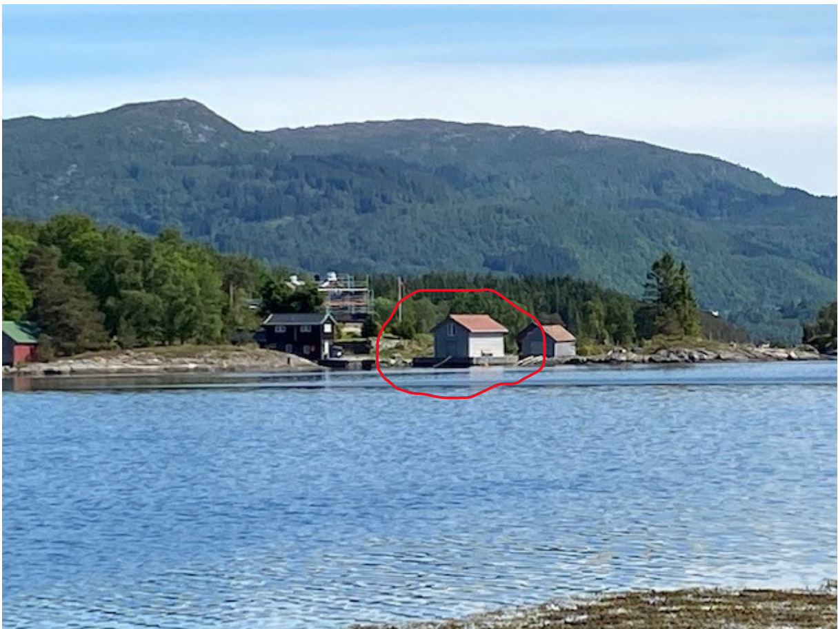
Gbnr 215/3 Godkjenning av kai 2014.