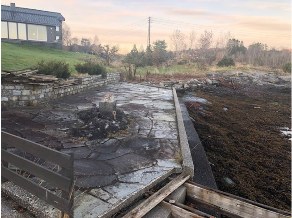
Gbnr 212/4 - 2020