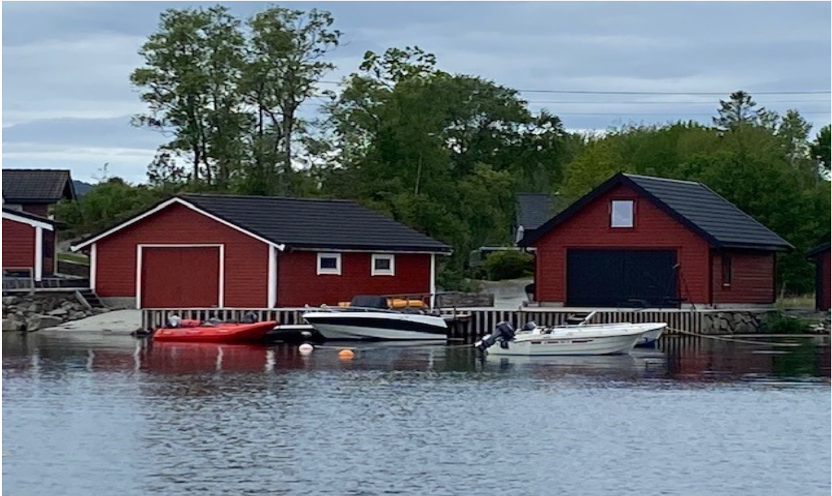
Gbnr 244/52 Godkjent kai og flytebrygge i 2015.