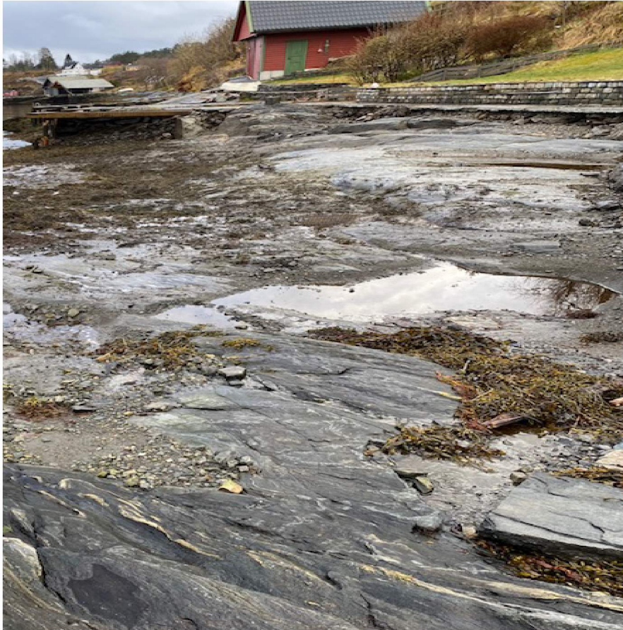
Gbnr 212/45 2020 etter fjerning av platting