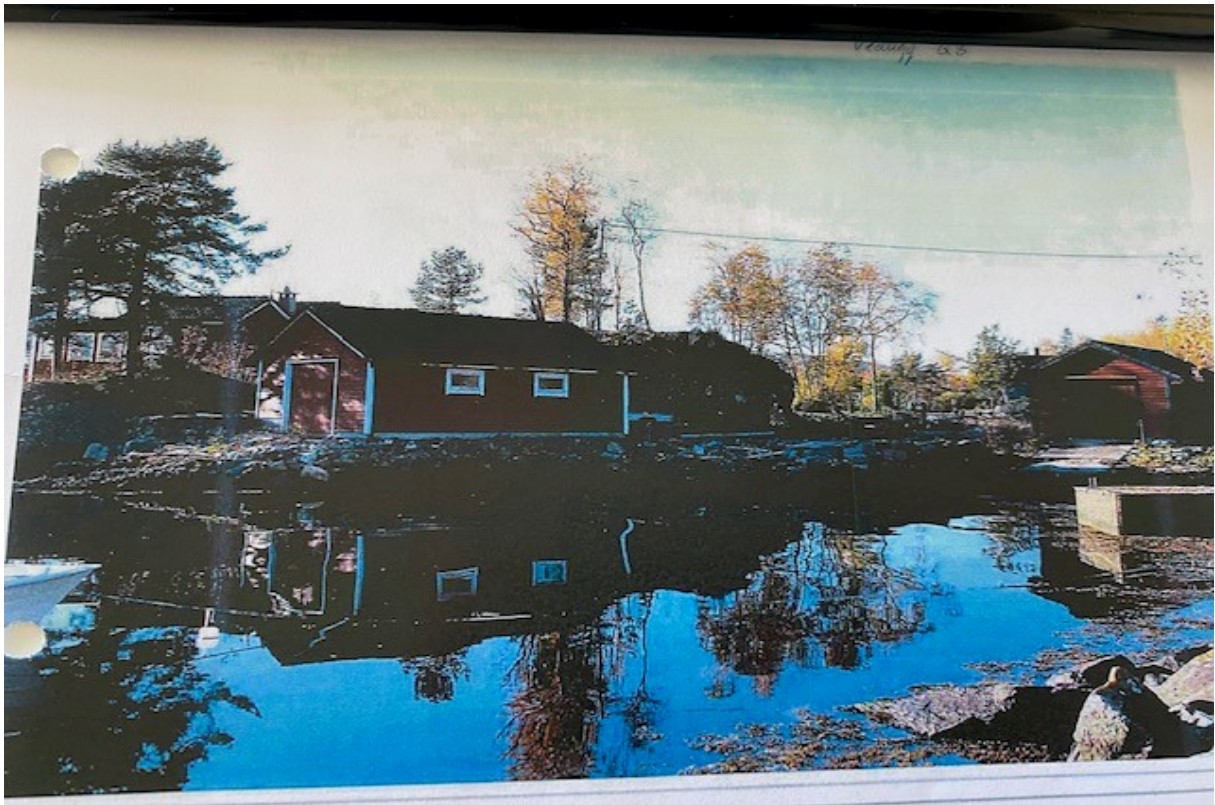
Gbnr 244/52 bilde 2014