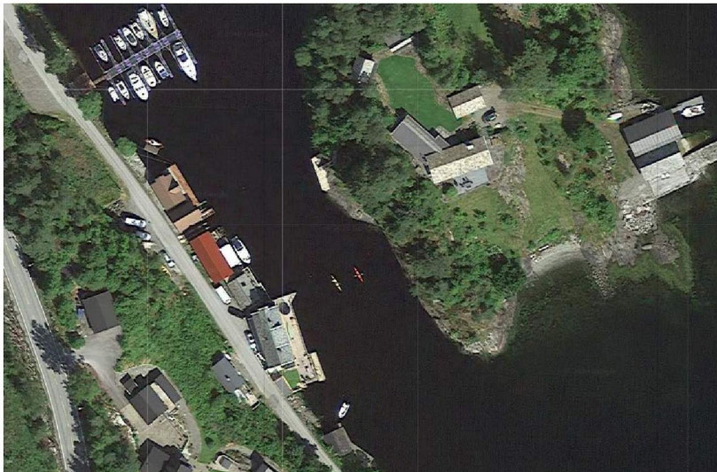
Gbnr 212/66 Generell godkjenning av utbygging i strandsonen.