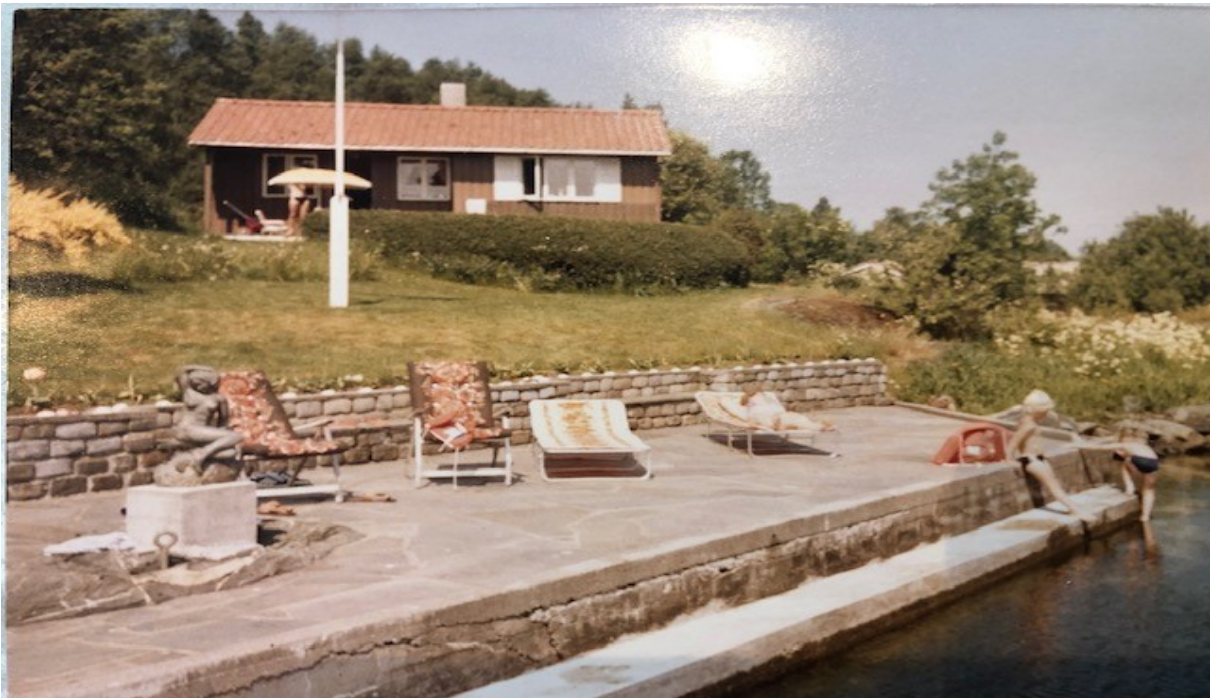
Gbnr- 212/45 åttitallet