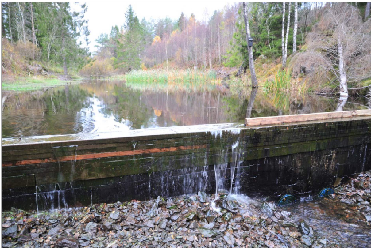
Figur 2: Damkonstruksjonen i renseseparken ved Sveåsen, 16.10.18. Vann passerer både over og under dammen.