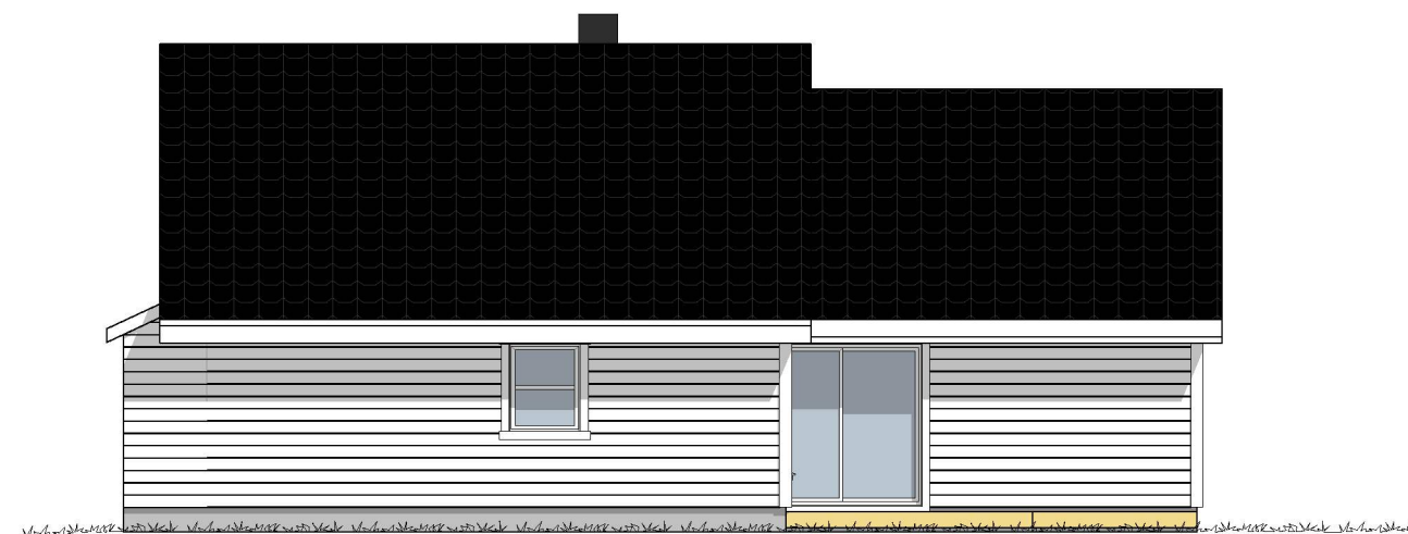
FASADE MOT SØR/VEST