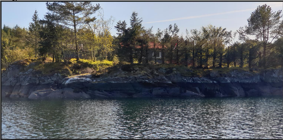
Foto som er vedlagt klagen underbygger klagar si vurdering av verknaden på omgjevnaden:

Kjeldsholmen slik den fremstår i dag, er delvis skogkledt slik at vegetasjon er med på å skjerme eksisterende hytte for innsyn, og bidrar til å redusere fjernvirkningen av hytten. Dette vil også være gjeldende for nytt tilbygg. Sånn sett er jeg av den oppfatning at tilbygget i svært begrenset grad vil øke privatiseringen av strandsonen eller påvirke landskapet negativt. Det vil også være i min interesse å beholde vegetasjon for å skjerme for innsyn, samt begrense omfang av areal på holmen som fremstår som privatisert.