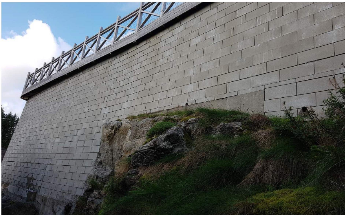
Mur i front mot vest med fjell i dagen mot naustrekke.