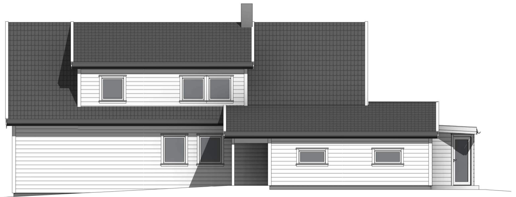
nordøst 1 : 100