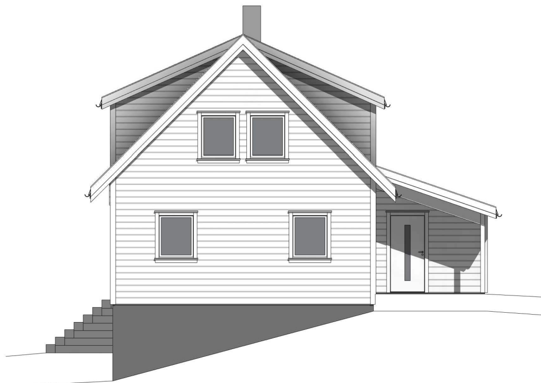
sørøst 1 : 100