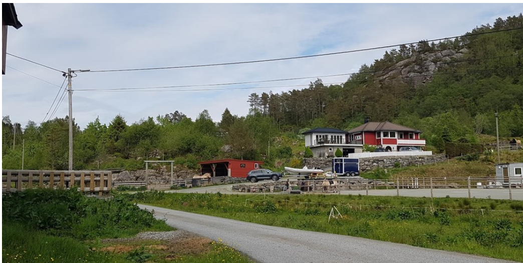
Figur 3 Huset som er søkt frådelt (raudt hus til høgre i bile)

Som det går fram av bilete og kart har dette huset eigen tilkomst frå kommunevegen, men felles innkjørsel med ridebane/landbruksveg.