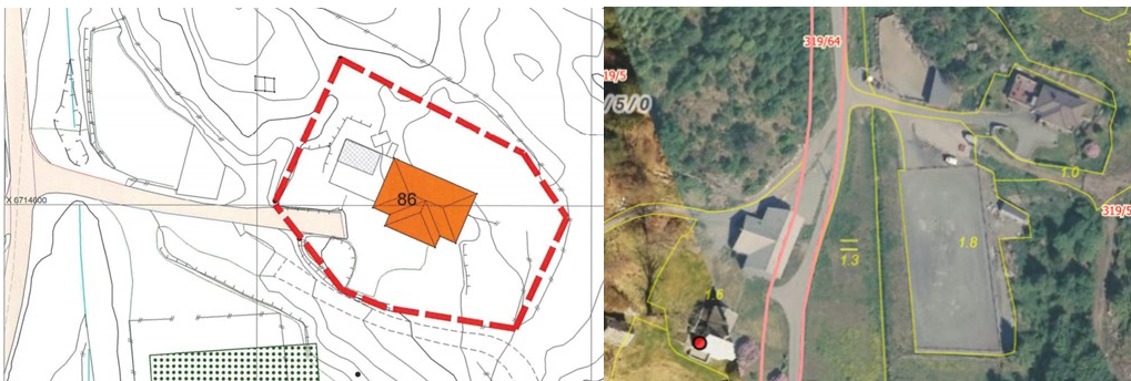
Figur 1 omsøkt frådeling og flybilde same stad

Saka gjeld søknad om frådeling av parsell på 1,1 daa med påståande bustad i landbruk,- natur- og friluftsområde (LNF) på gbnr 319/5 Sagstad nedre. Landbruksavdelinga har fått oversendt søknad om dispensasjon til uttale. Søknad krev samtykke til deling etter jordlova § 12, og dette må vurderast før dispensasjonssaka vert endeleg avgjort.