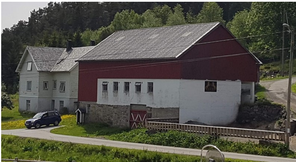
Figur 2 Driftsbygning og kårhus

Tunet med kårhus, driftsbygning og uteløe ligg på vestsida av vegen. Det eldste bustadhuset er fullstendig rehabilitert, og det er mor til søkjarr som bur her. Huset som no er søkt frådelt ligg på austsida av kommune vegen. Drifta på bruket er hestesenter/rideskule, og driftsbygning er i bruk til stallar. Det er dotter av noverande eigar som driv foretaket, og jordbruksareala vert brukt til beite for hestane. Det er bygd ridebane som ligg på austsida av kommunevegen.