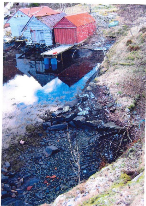
Fig 1 c Det aktuelle området