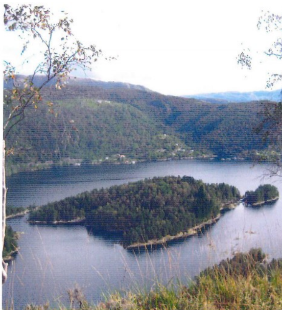
Fig 4 a. Øygruppen i tidde Skudenesfjorden