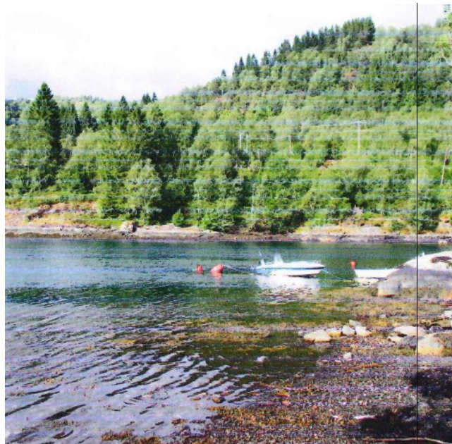
Fig 4 b Området på andre sida av vassbotnen