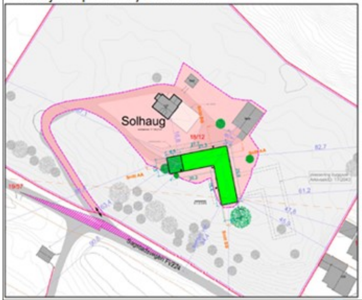
Situasjonsplan ny søknad