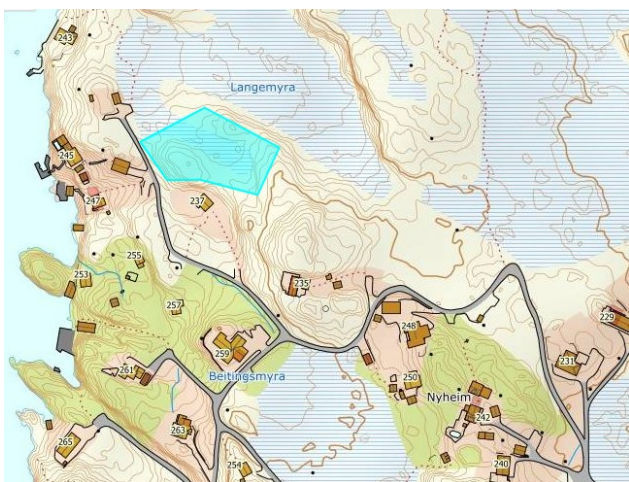
Kartutsnitt – byggjegrense mot sjø KDP