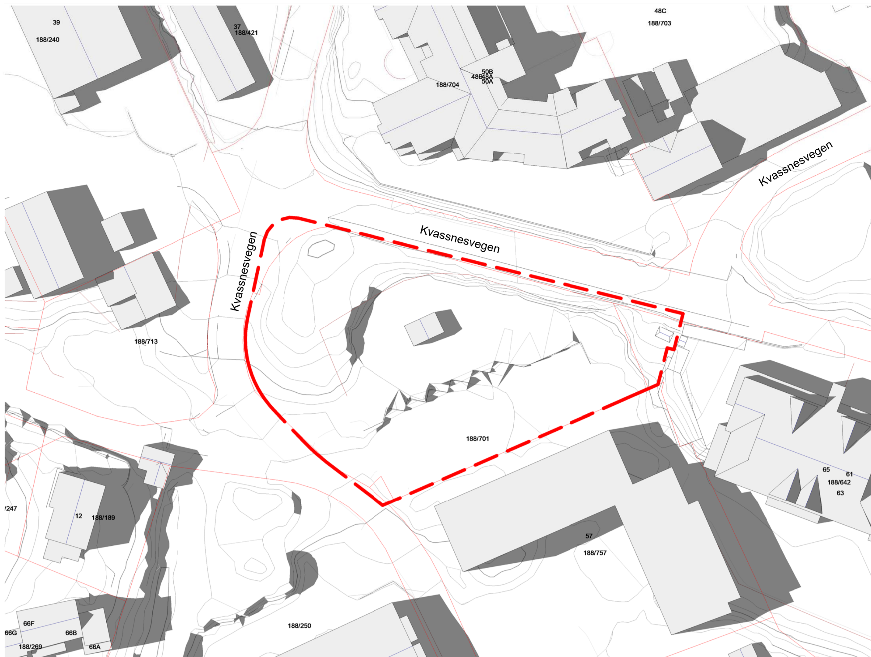
kl. 18.00 - sommersolverv