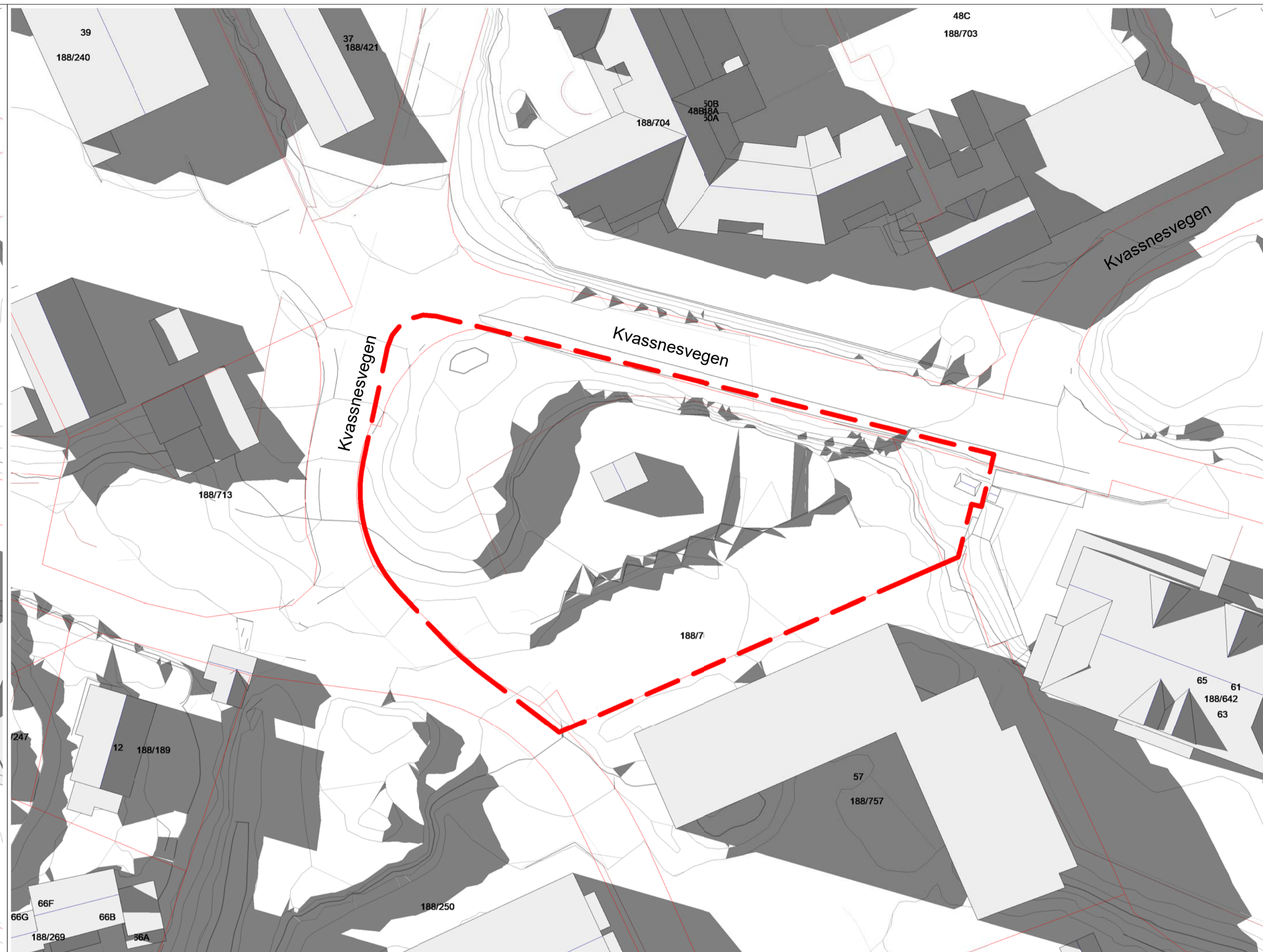
kl. 20.00 - sommersolverv