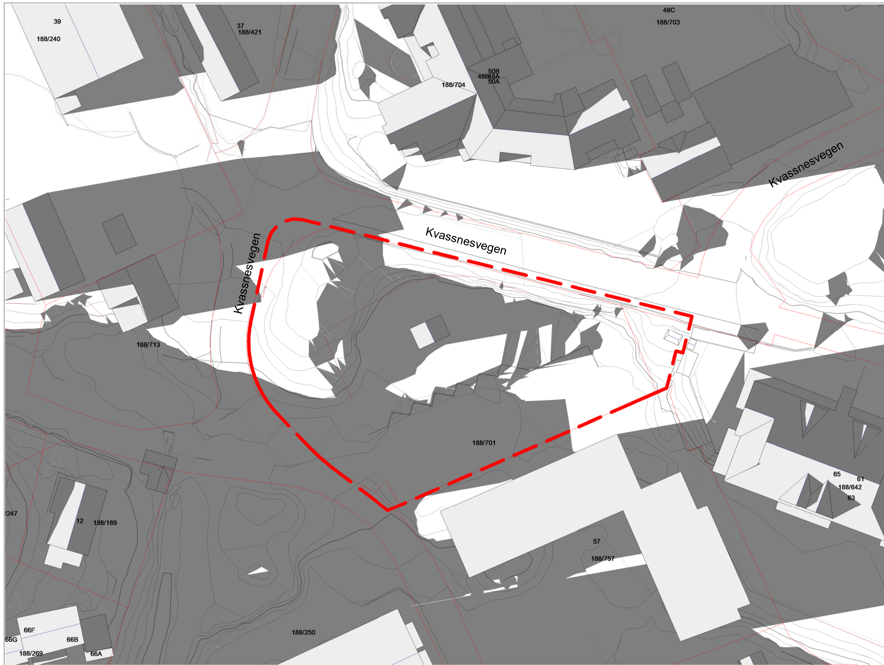
kl. 18.00 - vårjevndøgn