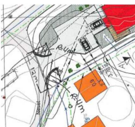
Avkjørsle med svingradius R = 4 meter.

Vegen er regulert av ei 30-sone. Sikt i avkjørsla vert difor satt til minimum 3 x 20 meter. I brev datert 05.05.2020 ba kommunen om nytt situasjonskart som viser avkjørsle med målsett svingradius. Nytt situasjonskart er svingradius opplyst å være R = 4 meter. Avkjørsla er ikkje teikna inn med denne svingradiusen. Når ein teiknar inn svingradius (ihht forskrift om «alminnelige regler om bygging og vedlikehold av avkjørsler fra offentlig veg») ser ein at ein får ei endring i plassering av avkjørsla.