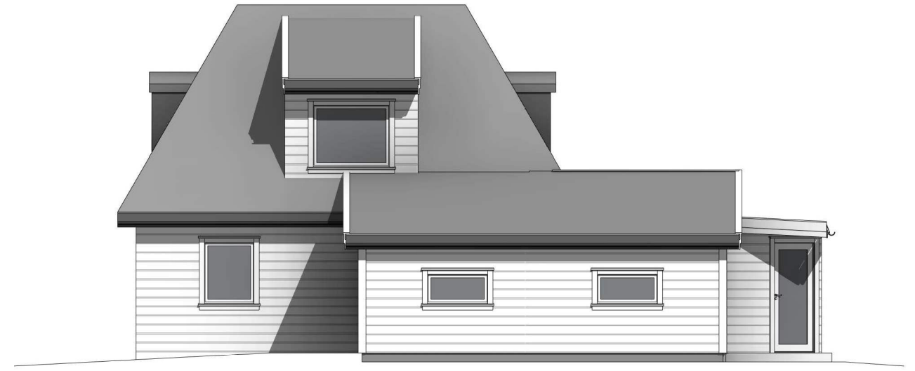
nordøst 1 : 100