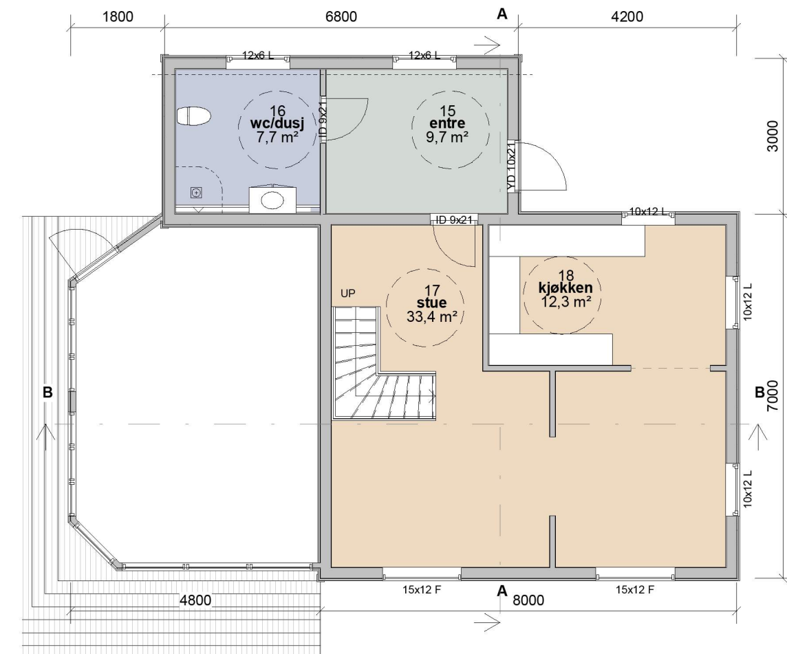
1. Etasje 1 : 100