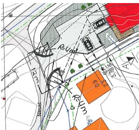
Avkjørsle med svingradius R = 4 meter.

Vegen er regulert av ei 30-sone. Sikt i avkjørsla vert difor satt til minimum 3 x 20 meter. I brev datert 05.05.2020 ba kommunen om nytt situasjonskart som viser avkjørsle med målsett svingradius. Nytt situasjonskart er svingradius opplyst å være R = 4 meter. Avkjørsla er ikkje teikna inn med denne svingradiusen. Når ein teiknar inn svingradius (ihht forskrift om «alminnelige regler om bygging og vedlikehold av avkjørsler fra offentlig veg») ser ein at ein får ei endring i plassering av avkjørsla.