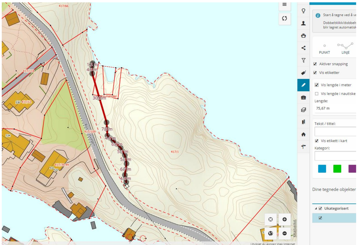
Figur 2 Føringsvei måle ut på kommune kart.

I strandsonen vil kabelen bli tildekket med løs masse for at den ikke skal være til hinder for almen ferdsel. Kabelen vil også være nedgravd noen meter ut på fjæra sjø slik at den ligger beskyttet for eventuell båttrafikk som legger til i strandsonen. På plasser der tildekking med løs masse ikke er mulig blir kabelen klamret fast til berg og eventuelt lagt i rør dersom man ser det nødvendig.