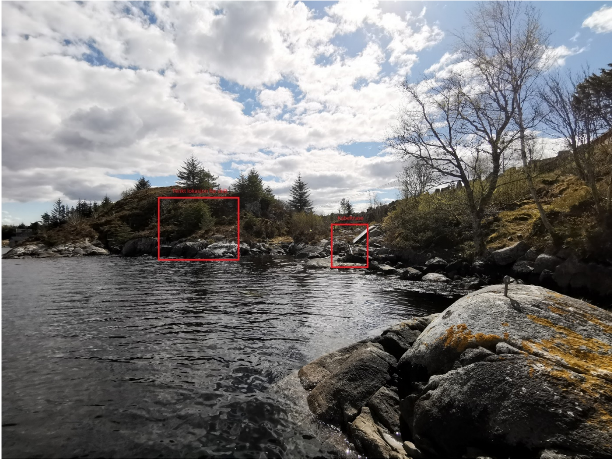
Figur 5 plassering av skilt på land.