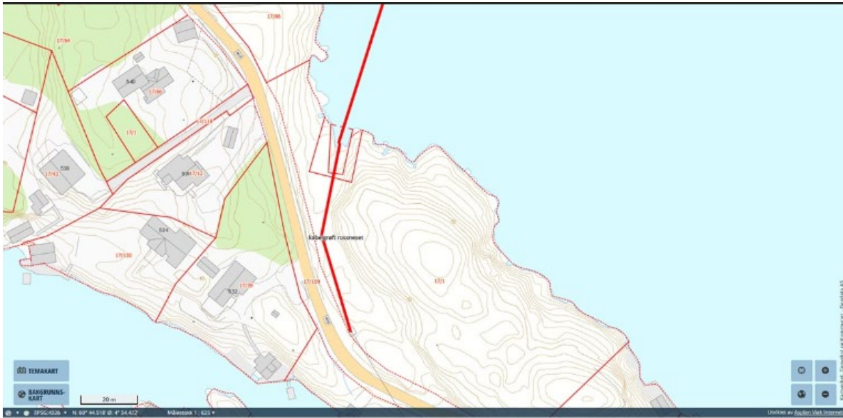
Figur 1 Skisse fra søknad 2018