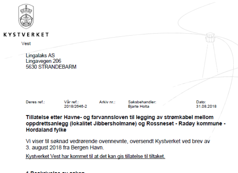
Figur 3 Tillatelse fra Havne og farvannsloven