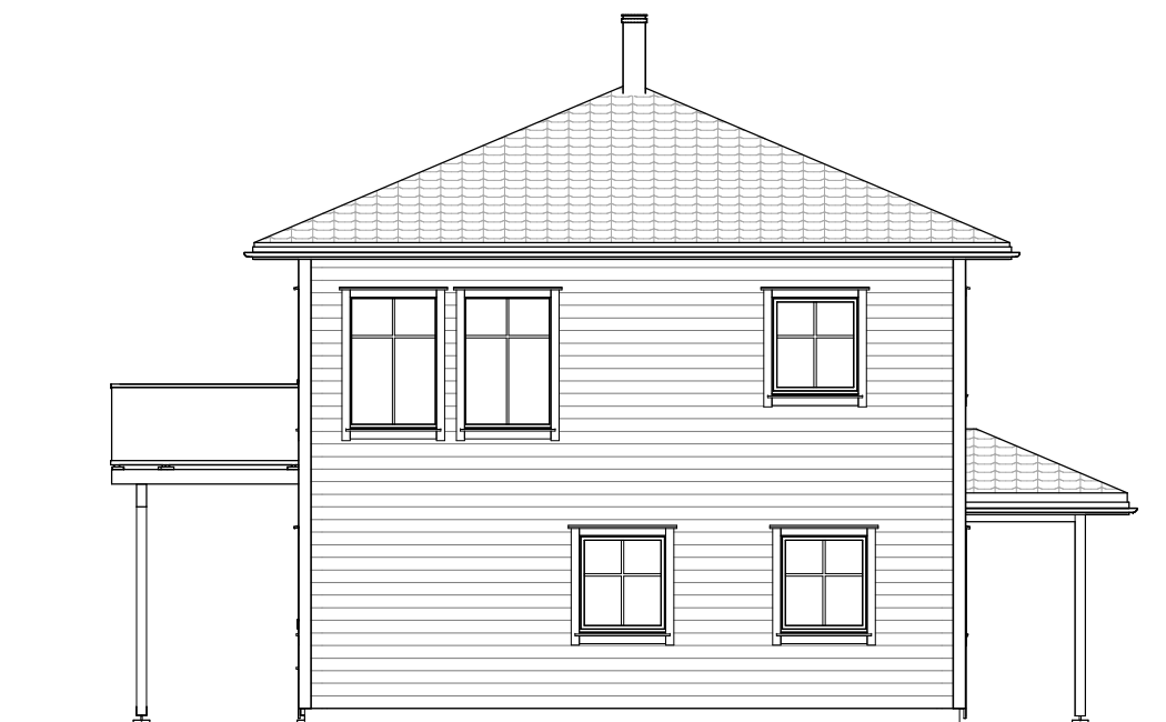
FASADE 4 1 : 100