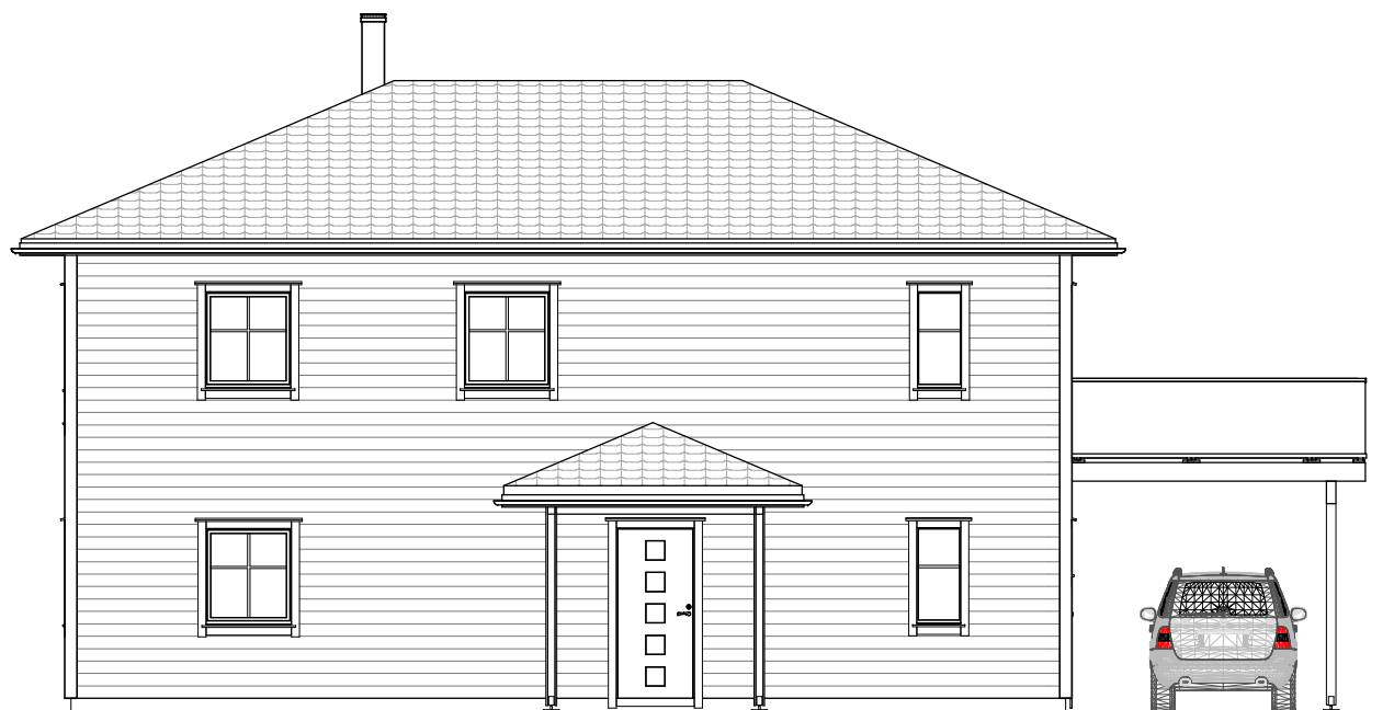
FASADE 1 1 : 100