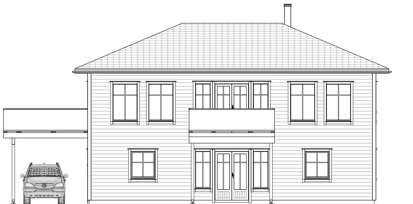
FASADE 3 1 : 100