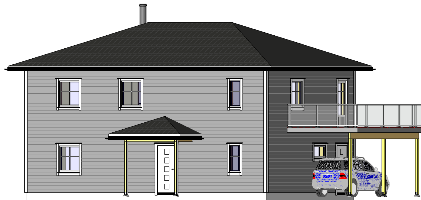
3D Modell - 1