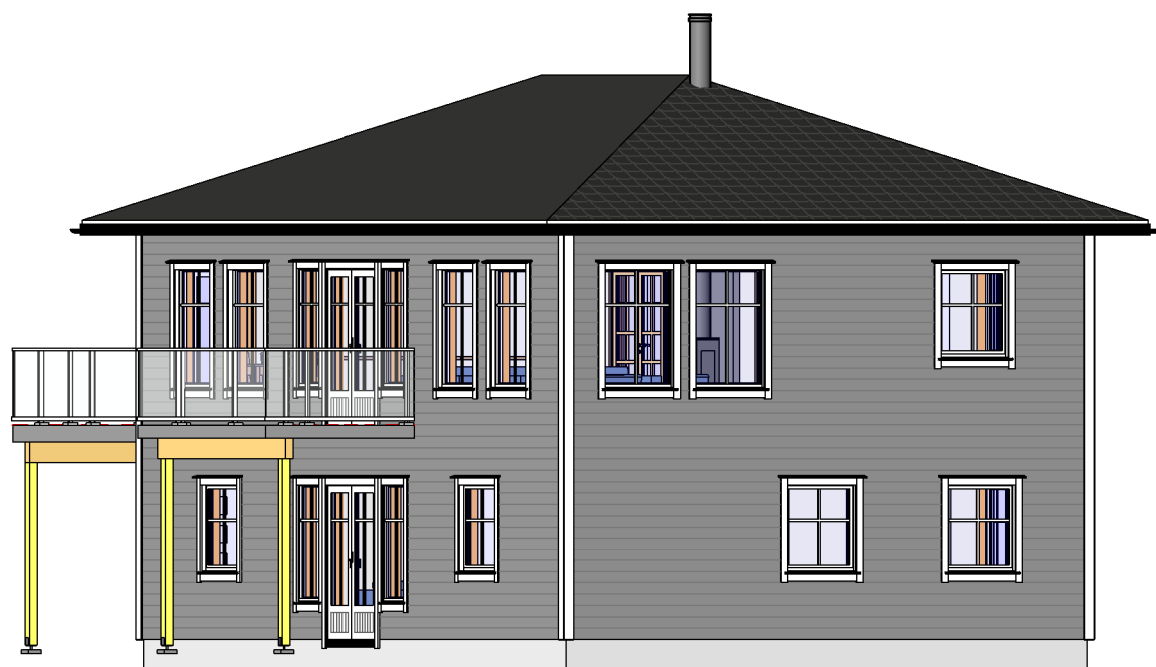
3D Modell - 2