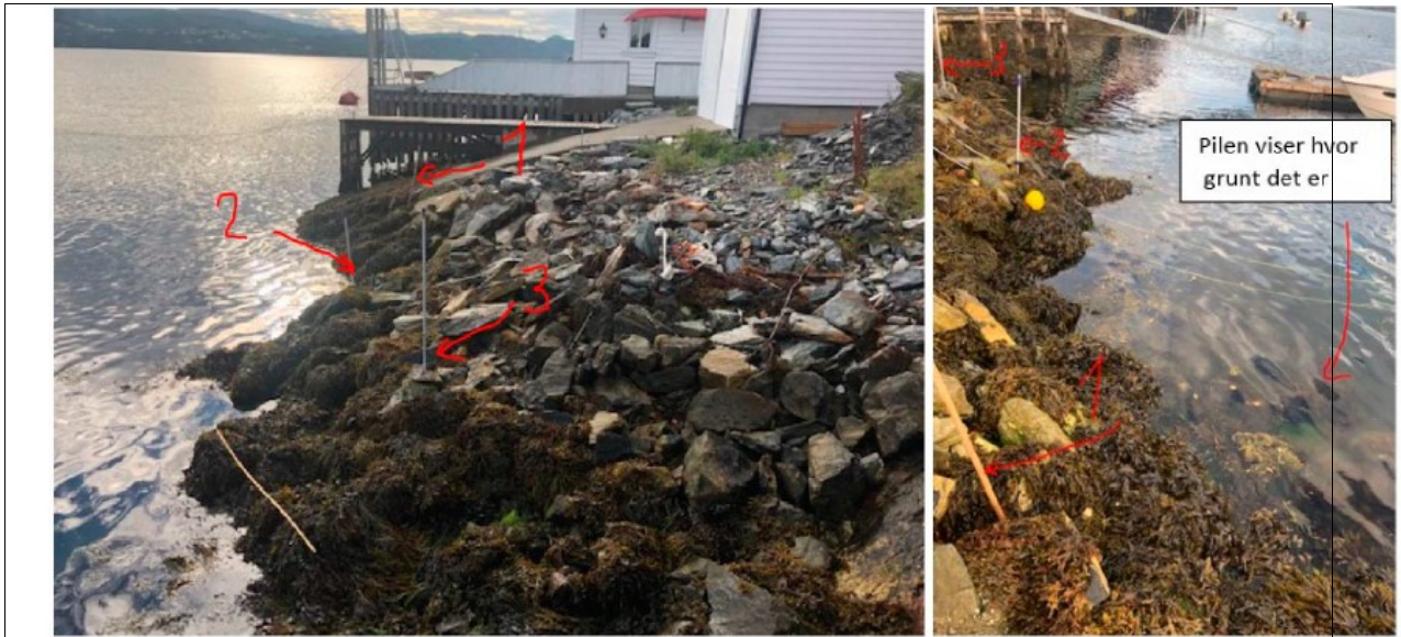
Bilete frå klagen – flo (ca. 1 time etter full flo)