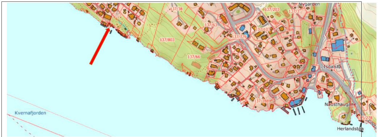
Situasjonskart, mottatt med søknaden den 06.03.2020