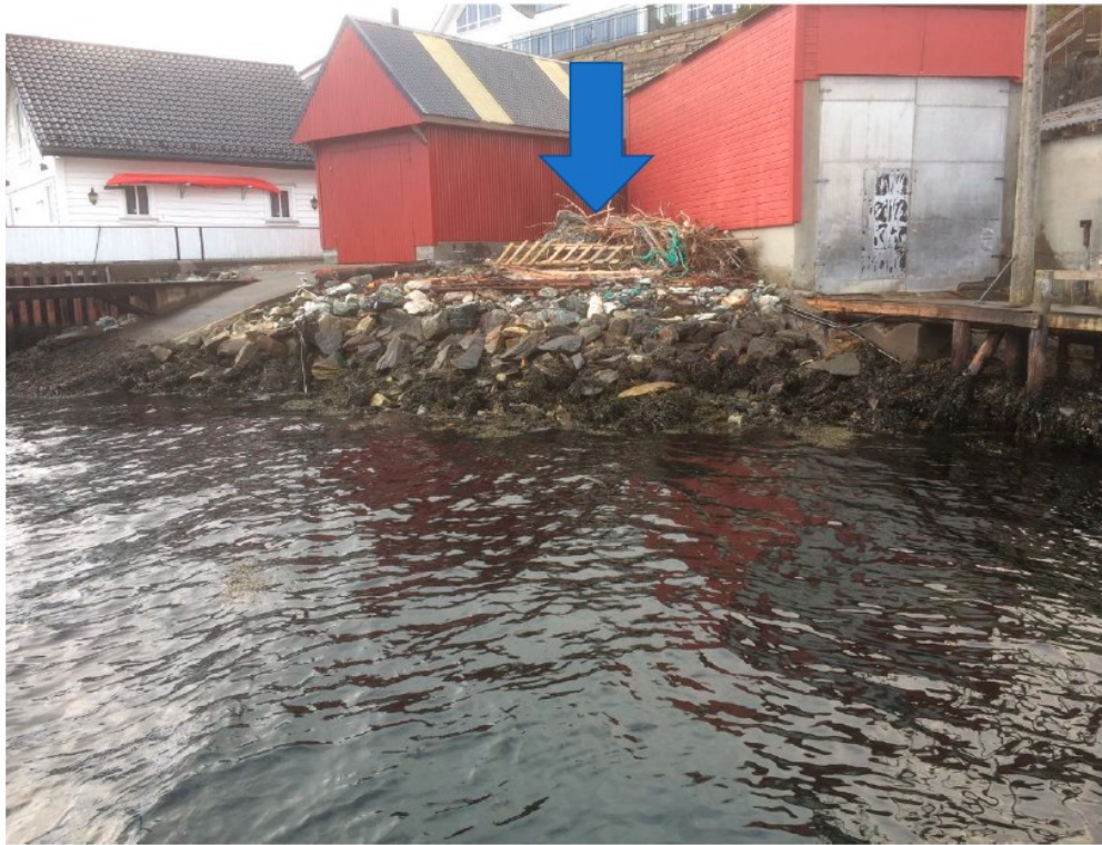
Bilete 1-4 lagt ved klagen – fjære (ikkje full fjære)