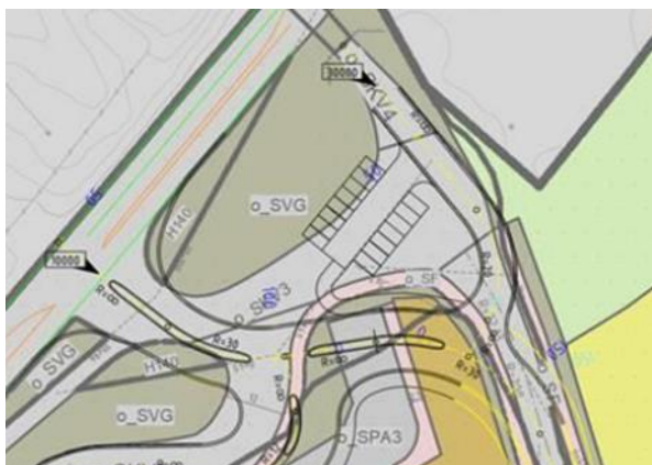
Parkeringsplass skissert i teikning til møte 27.05.2020.

I planframlegget som no er på høyring, er parkeringsplassen utvida og avkøyrsla flytta. Statens vegvesen kan ikkje akseptere ein parkeringsplass som føreslått i det reviderte planframlegget. Ein parkeringsplass som ligg så tett på kryssområdet ved E39 kjem i konflikt med omsynet til europavegen. Vi er også kritiske til at frisiktlinja frå avkøyrsla går inn i kulverten under E39. Statens vegvesen vurderer at dette ikkje er ei eigna plassering av ein parkeringsplass, og ber om at den vert teken ut av plankartet. Vi ber om at arealet vert regulert til annan veggrunn.