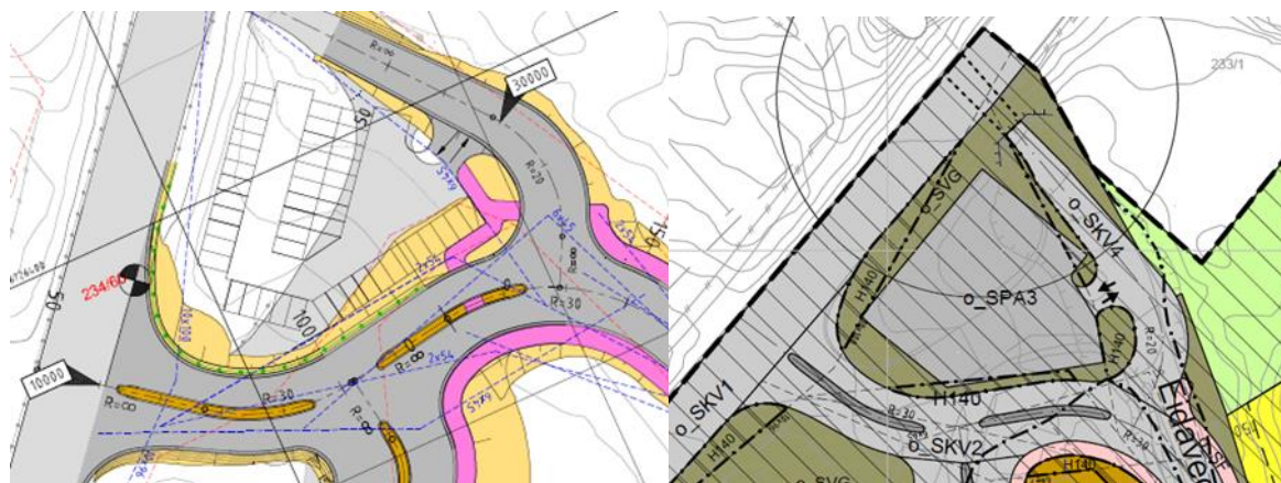
Parkeringsplass i vegteikning og plankart på høyring.

I planframlegget som no er på høyring, er parkeringsplassen utvida og avkøyrsla flytta. Statens vegvesen kan ikkje akseptere ein parkeringsplass som føreslått i det reviderte planframlegget. Ein parkeringsplass som ligg så tett på kryssområdet ved E39 kjem i konflikt med omsynet til europavegen. Vi er også kritiske til at frisiktlinja frå avkøyrsla går inn i kulverten under E39. Statens vegvesen vurderer at dette ikkje er ei eigna plassering av ein parkeringsplass, og ber om at den vert teken ut av plankartet. Vi ber om at arealet vert regulert til annan veggrunn.