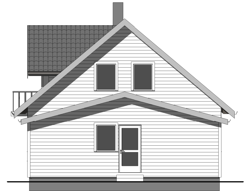
FASADE MOT SØR