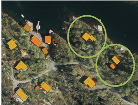
Eksisterende fritidsboliger ligger på festepunkt 83/1/11 og 2.

Området har tidligere vært regulert i reguleringsplan for Spjotøy hyttefelt med planid: 1263-05101981 men denne er avløst av KDP for Lindåsosane, Lygra og Lurefjorden.