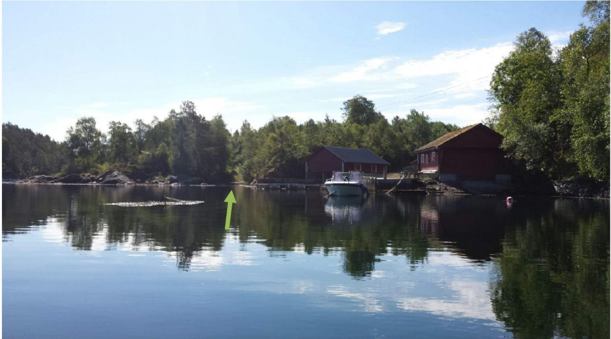
Foto tatt vår 2018, fra nordvest Den grønne pilen viser vågen. Til høyre for vågen ligger det eksisterende naustområde.