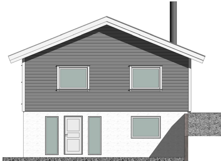
Fasade mot nord-vest 1 : 100