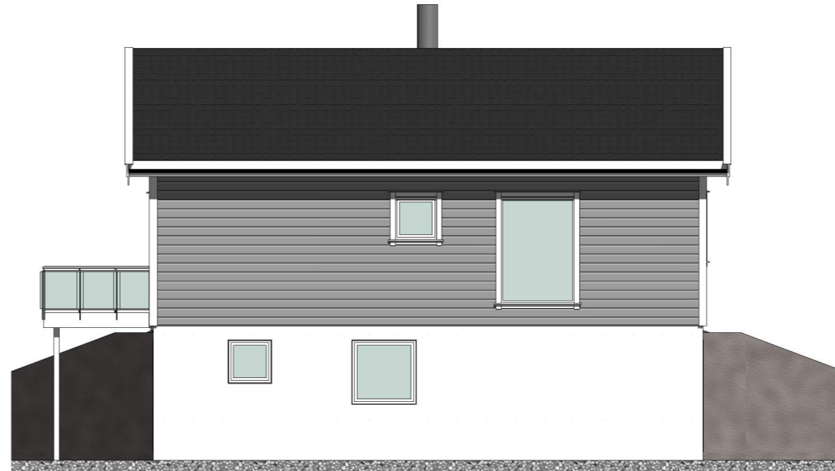
Fasade mot nord-øst 1 : 100