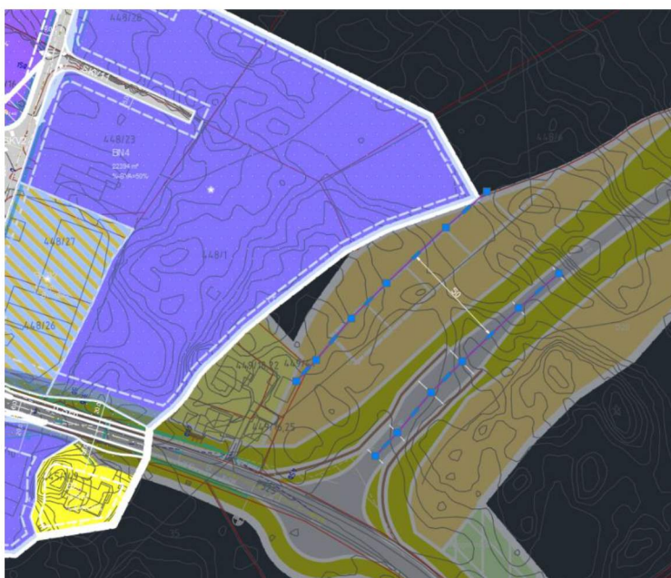
Figur 2: Utsnitt som synar delar av dei aktuelle planane med 50 meter offsett av senterlinje veg i plan for fv. 565 markert.

I BN4 er byggjegrænsa synt med 4 meter frå føremålsgrænse/eigedomsgrense. Denne byggjegrænsa er godt utanfor 50 meter frå senterlinje veg for «armen» i reguleringsplanen for fv. 565. Det vert difor ikkje gjort endringar på byggjegrænse i BN4.