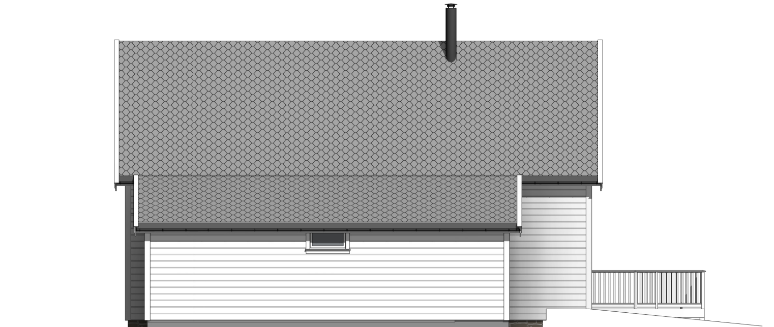
nordvest 1 : 100