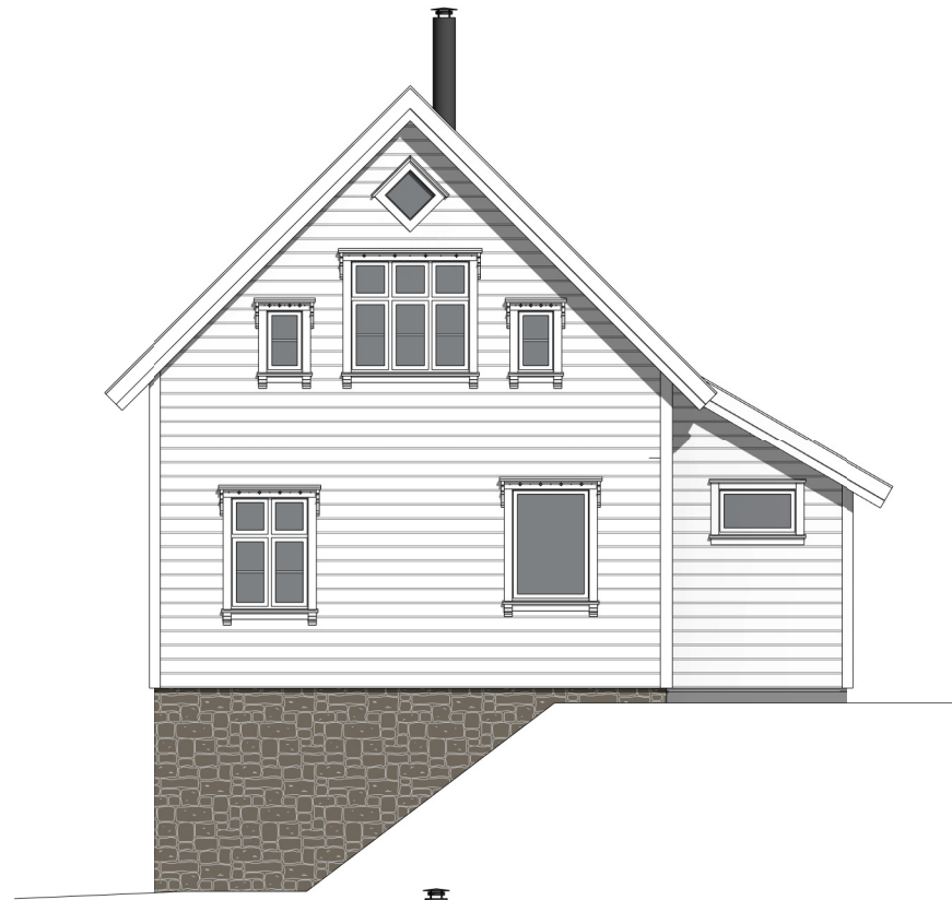
nordøst 1 : 100