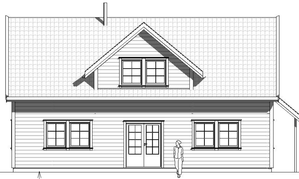
Fasade mot sør-vest

m.o.h. 64 +19,25 moh mønehøyde 19 18 17 16 +15,1 moh ok. gulv plan 2 15 14 +12,3 moh ok. gulv plan 1 12 11 m.o.h.