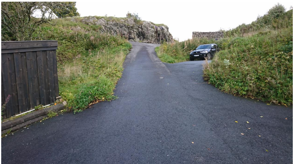
Foto - Tilkomst og parkering.