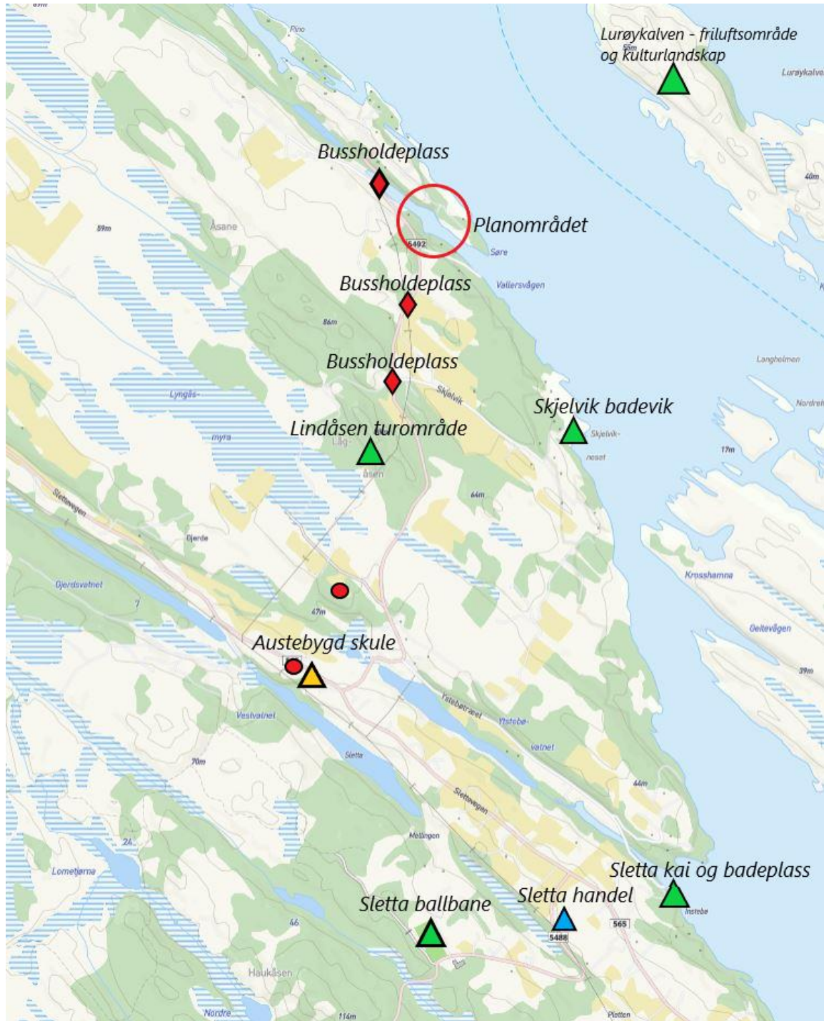
Kart – analyse av området