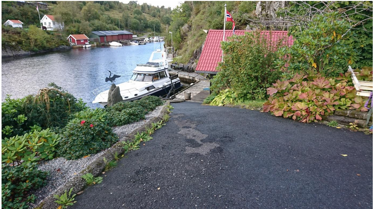
Foto – Kaifront og tilkomst til naust.

Med tanke på området rundt og hvordan bebyggelsen er i nær tilknytning til planområdet kan man se av foto at tiltakene passer godt inn i landskapet. Kaifronten følger naturlig terrenget og det er fint opparbeidet med beplantning rundt.