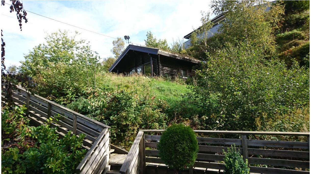
Foto - Anneks som leies ut til en lokal ungdomsklubb på Radøy.

Flytebryggen med båtplasser ligger godt inne i viken og åpner opp for trygge av og påstigninger med båt, samt at den tilfører en god plass å drive med fiske og bading.