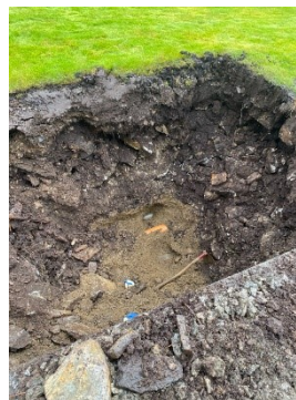
Påvist plassering av kommunalt leidningsnett