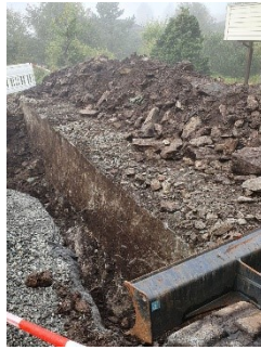
Mur fundamentert på fast fjell