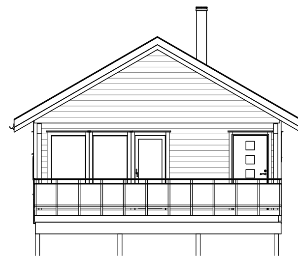
FASADE 2 1 : 100