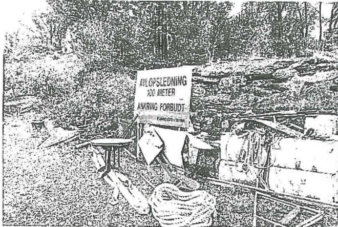
Skilt på tomten.