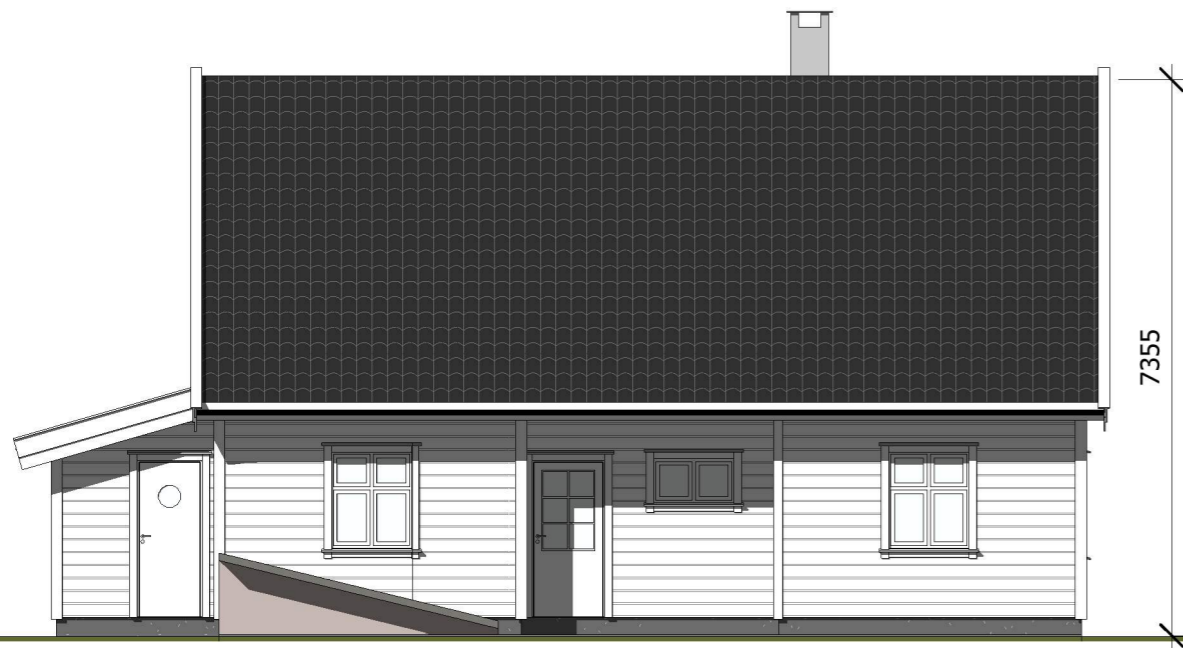
Nord 1 : 100