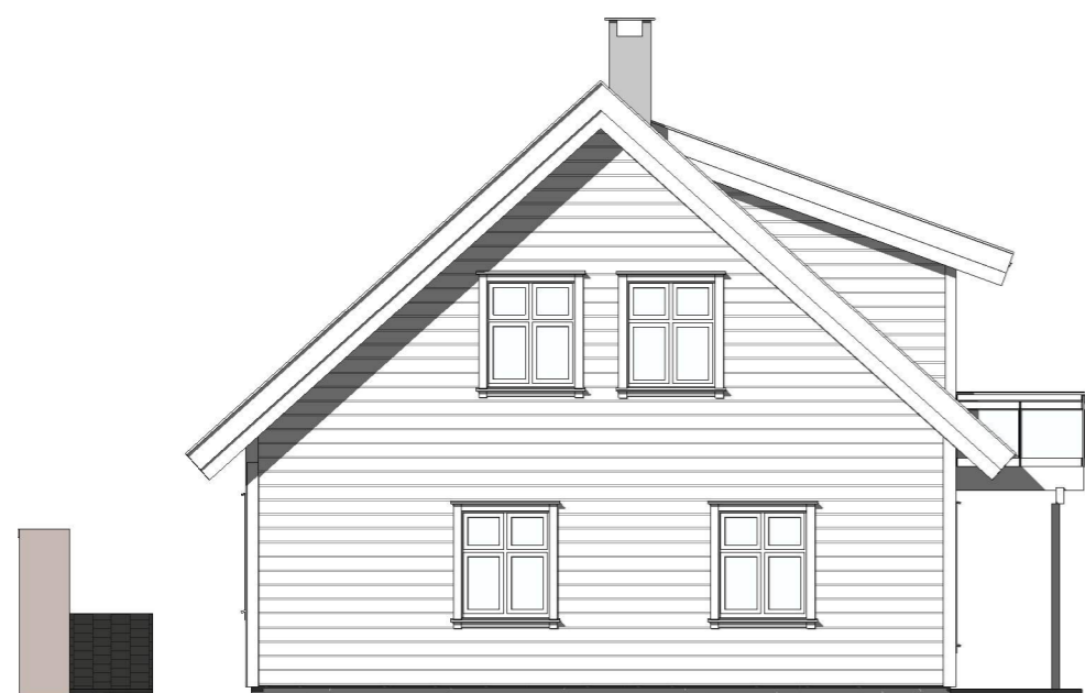
Vest 1 : 100

ing. asbjørn danielsen as RÅDGIVENDE INGENIØRER I BYGGTEKNIKK