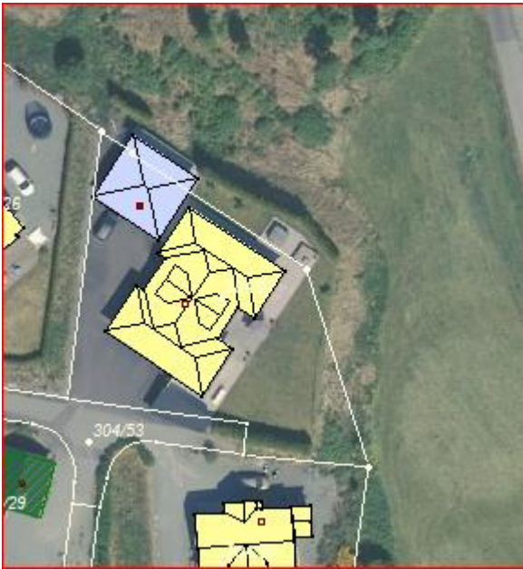
Ortofoto 2018 m/ eigedomsgrensar