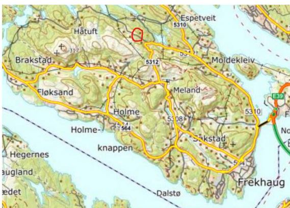
Figur 1 oversiktskart Holsenøy- aktuell stad merka med raud sirkel

Saka gjeldt lukking av eit lite parti av bekken i samband med erosjonssikring for kommunal veg, VA anlegg og EL grøft. Dette vil gje sikrare og betre overvatn handering for området og betra tilkomst til bustadhus. Det er truleg ikkje fisk i bekken så langt oppe pga vandringshinder nedstrøms.