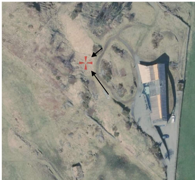
De sorte piler markerer fotostandpunkter, se følgende sider.

Nybygget tenkes plassert i umiddelbar nærhet til eksisterende resepsjon- og utstillingsbygg. Se rødt kryss på flyfoto, under: