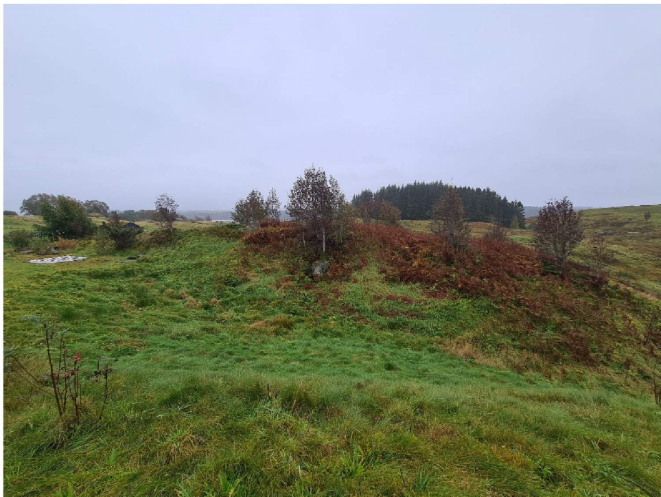
Foto sett fra kolle i nordøst, se sort pil på kart på forrige side

Bygget tenkes plassert i en senkning i terrenget. Mot vest (til venstre i bildet over) er det en nord-sørgående høyde og mot øst er det en kolle (der hvor personen står). Mot sør ligger den naturlige uteplass hvor skoleklassene spiser sin lunsj. Bygningen skal plasseres ned i terrenget og hensikten er at det kun er bygningens gavnl som vil være synlig fra nord.