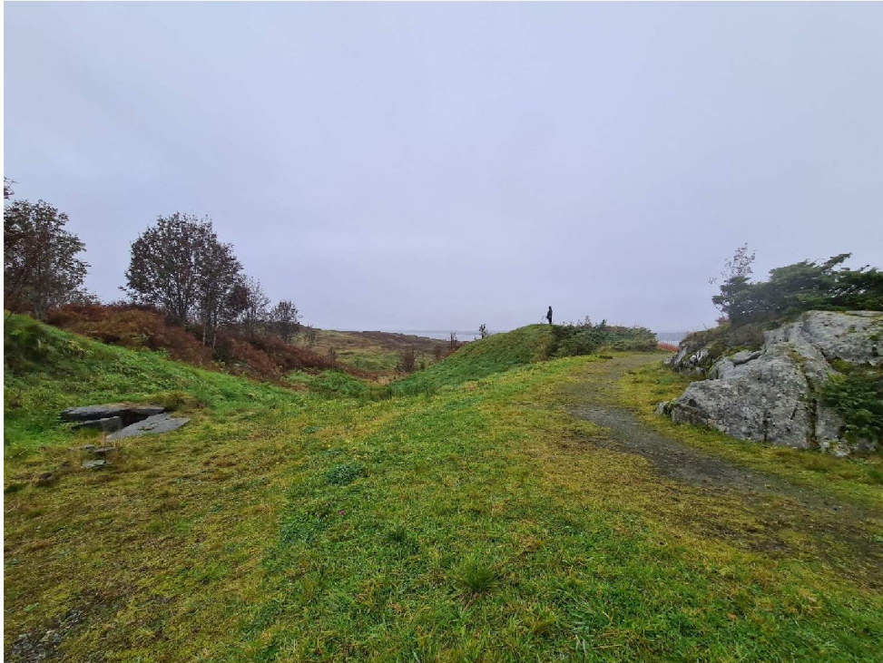
Foto sett fra sørvest mot nordvest, se sort pil på kart på forrige side

Bygget tenkes plassert i en senkning i terrenget. Mot vest (til venstre i bildet over) er det en nord-sørgående høyde og mot øst er det en kolle (der hvor personen står). Mot sør ligger den naturlige uteplass hvor skoleklassene spiser sin lunsj. Bygningen skal plasseres ned i terrenget og hensikten er at det kun er bygningens gavnl som vil være synlig fra nord.