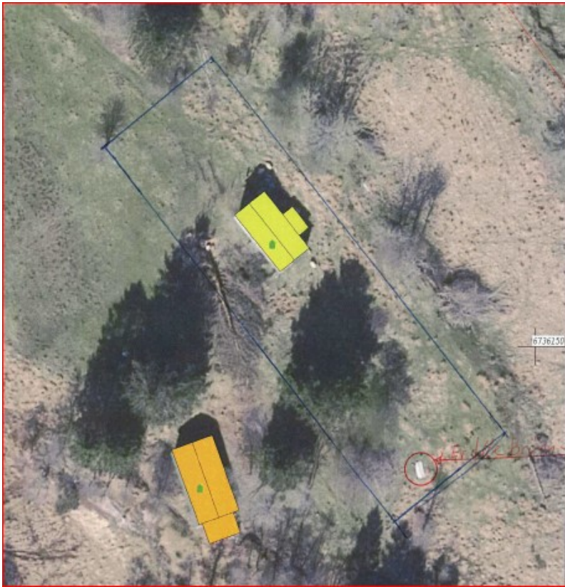
Utsnitt av situasjonsplan