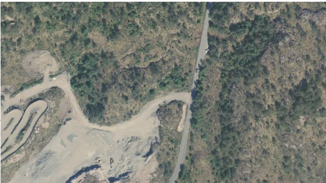
Figur 2 Flyfoto.