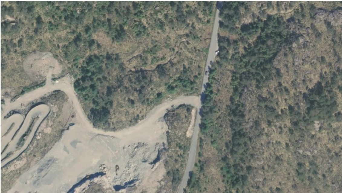
Figur 2 Flyfoto.