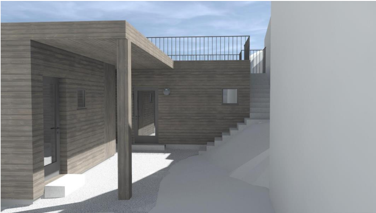
Figur 6 Illustrasjonstekning som fylgjer søknad om utslepp

Aktuelle teikningar som fylgjer som vedlegg.