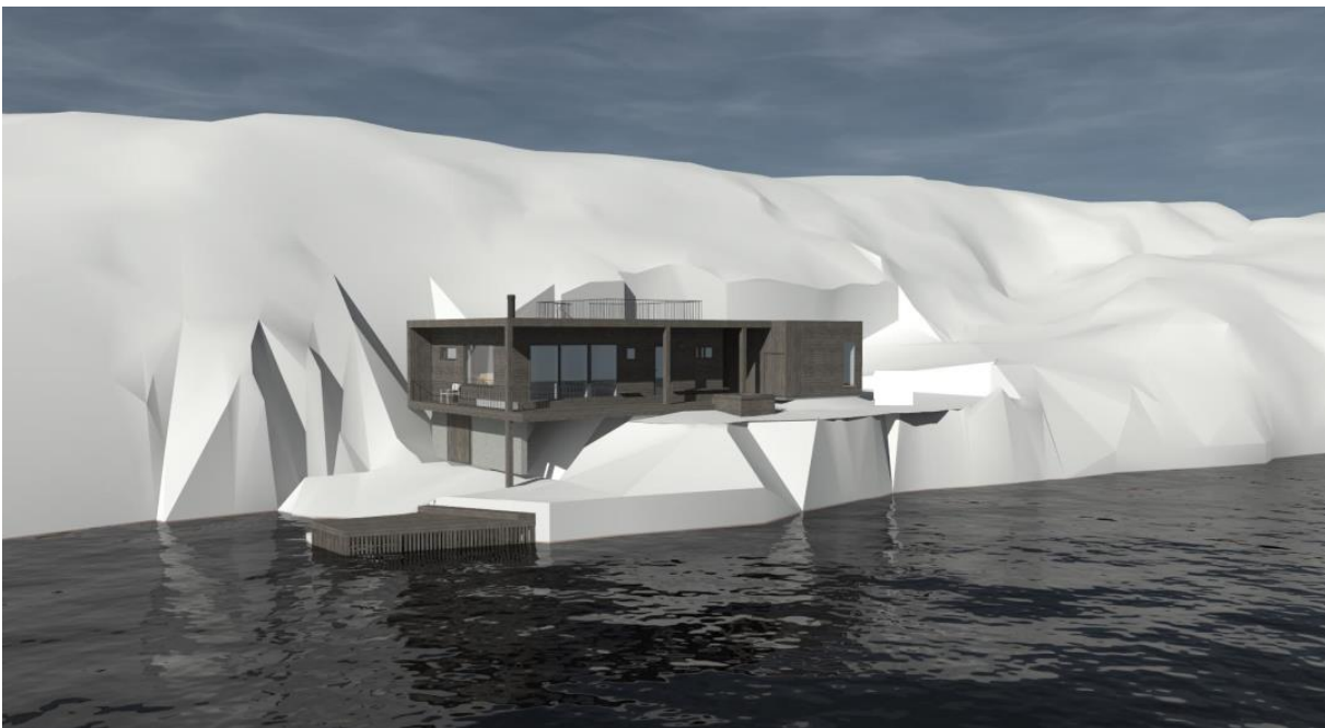
Figur 3 Illustrasjonsteikning som fylgjer søknad om utslepp

Illustrasjonsteikingane er tatt ut frå sak som omfattar søknad om utsleppsløyve. Det er påpeika i teikningane at dei er førebels teikningar og kun meint som illustrasjon.