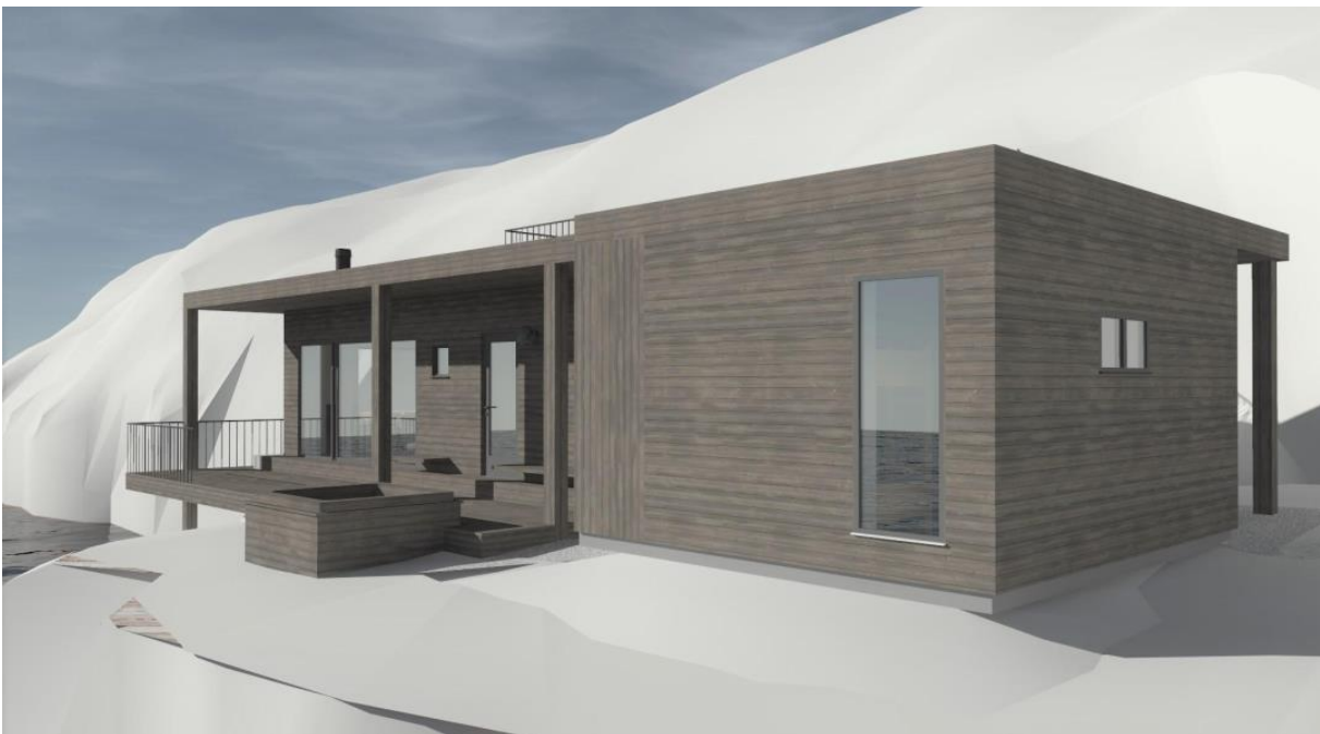
Figur 5 Illustrasjonsteikning som følger søknad om utslepp