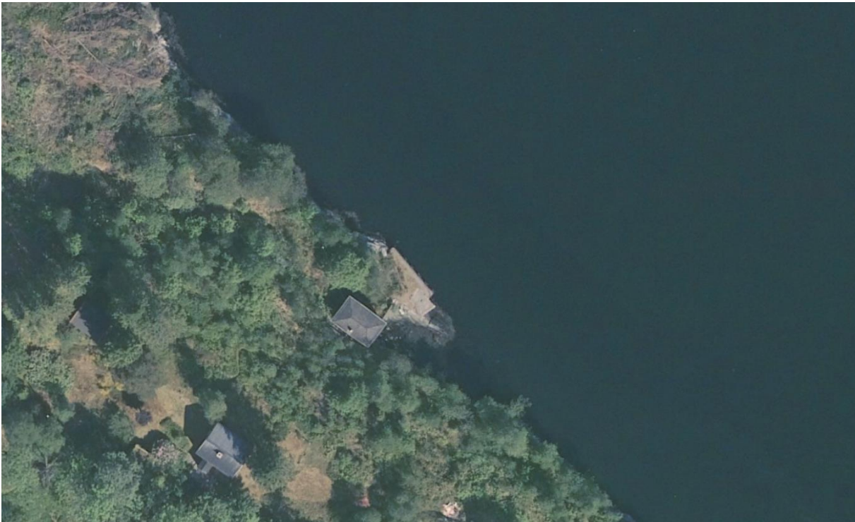
Figur 2 Ortofoto

Illustrasjonsteikingane er tatt ut frå sak som omfattar søknad om utsleppsløyve. Det er påpeika i teikningane at dei er førebels teikningar og kun meint som illustrasjon.