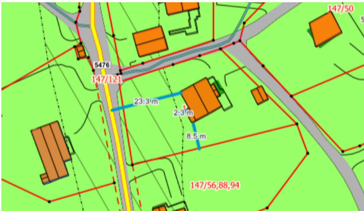
Kartutsnitt, Kommuneplan for Lindås

I forbindelse med ønsket om å bygge garasje til boligen på gbnr 147/87, sendes det hermed søknad om dispensasjon fra byggegrense mot fylkesveg, fastsatt i Kommuneplan for Lindås, nå Alver kommune.