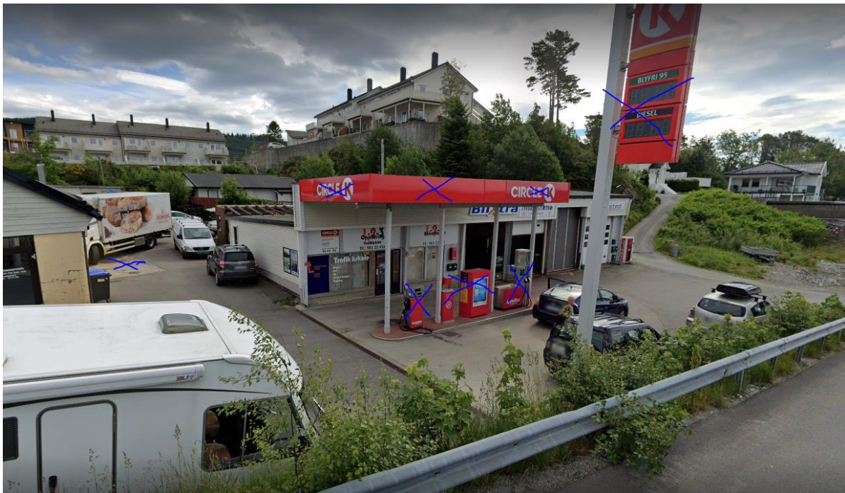
Bilde 1: Objekter som skal fjernes