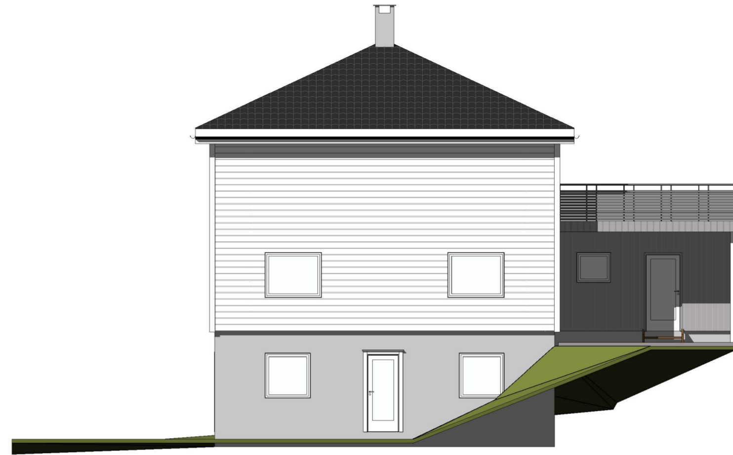
Nord 1 : 100