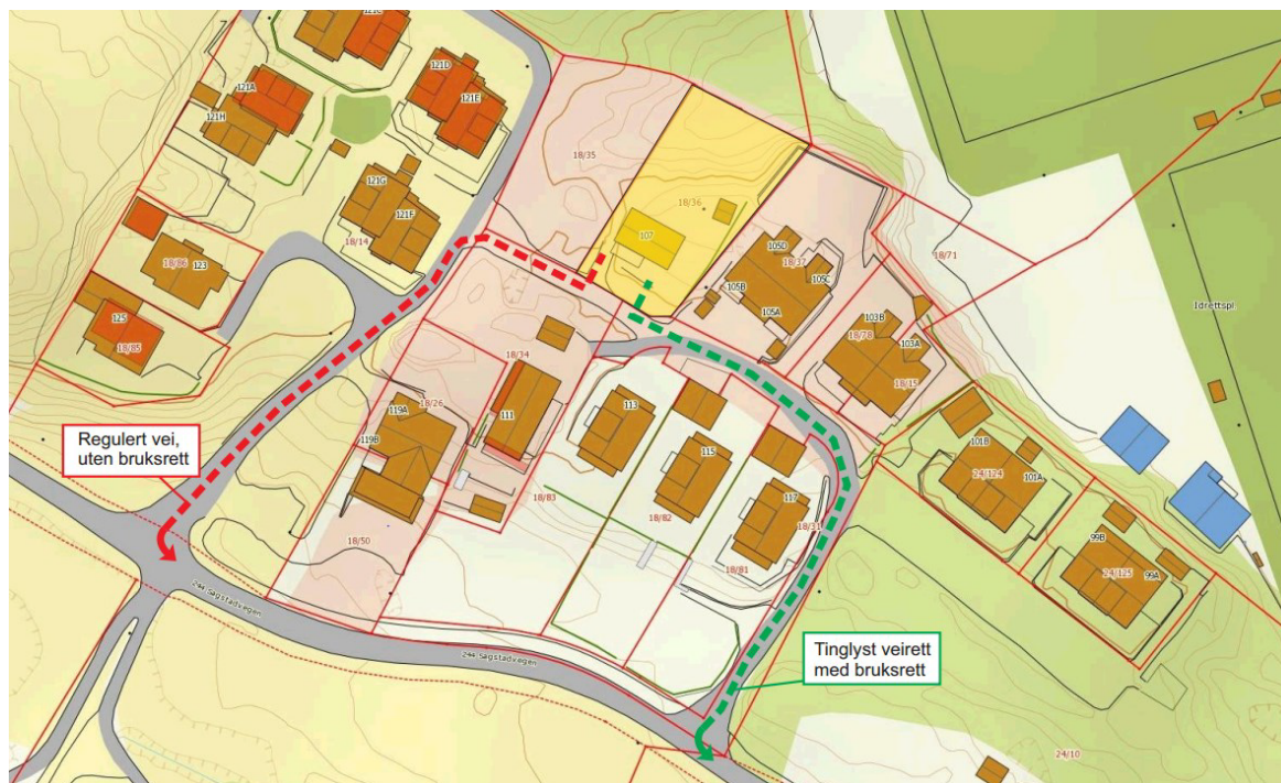
Figur 1: Tilkomst

Alver kommune har motteke søknad om dispensasjon frå gjeldande plan for tilkomstveg til gnr. 318 bnr. 36. I gjeldande plan har eigedomen tilkomst via den røde stripla linja på figur 1. Samstundes har eigedomen tinglyst vegrett via veg merka med grøn linje.