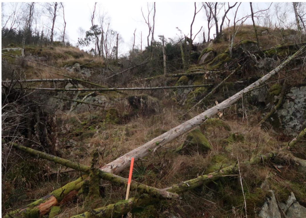
Bilde 2. Skråningen i øst med bratthet opp imot 70°. Bildet er tatt mot øst.