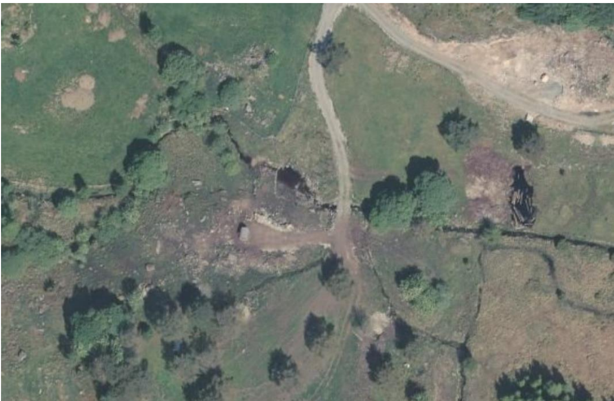
Figur 2 Ortofoto