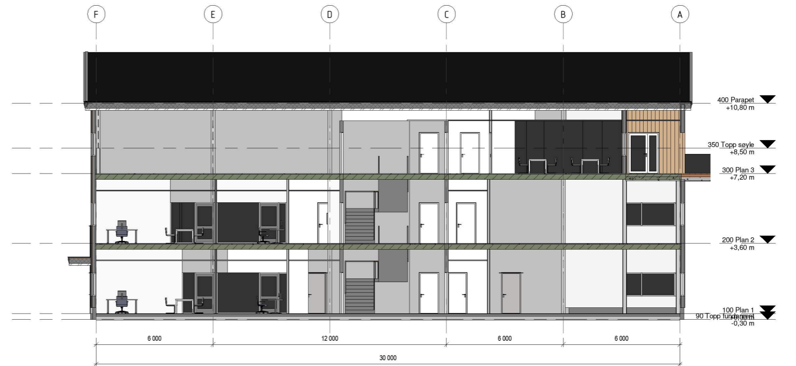
Snitt 3 1 : 100