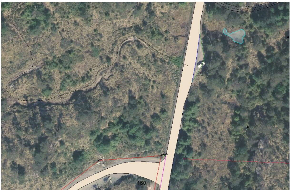
Figur 3 Ortofoto